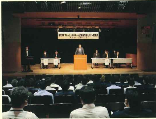
<全体での開講式の様子>

1年次に7回、2年次に6回の計13回ほど研修会を実施いたします。また、F&Uセミナー受講生全員が参加する開講式や修了式も開催いたします。