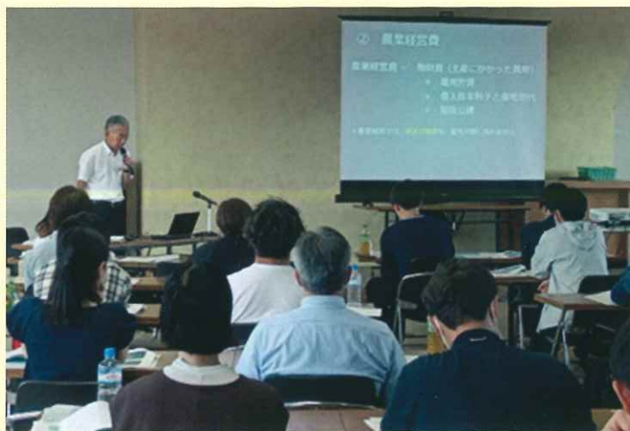
地区研修の講義（座学）