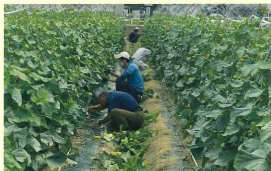
地区研修の講義 (指導農業士等による研修)

消費者ニーズや、流通・経営・都市農政・税務等について講演・視察研修などを通して学びます。