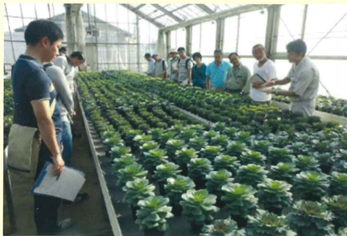
全体研修の視察（農林総合研究センター）