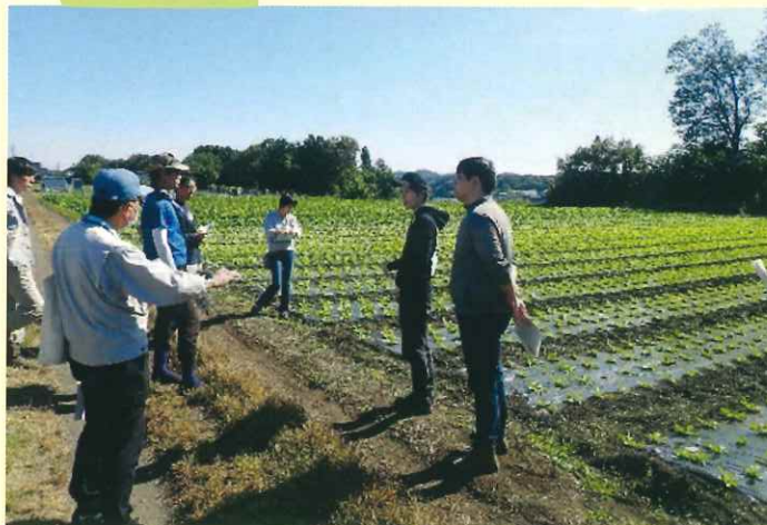
地区研修の視察（八王子市）