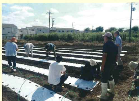
地区研修の講義(指導農業士等による研修)

※受講人数が10人以下のコースは、地区研修の選択科目を農業改良普及センター間合同で開催することがあります。