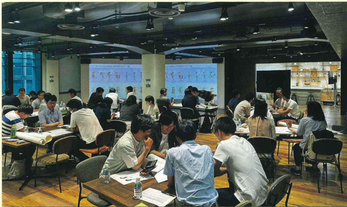
全体研修のグループワーク