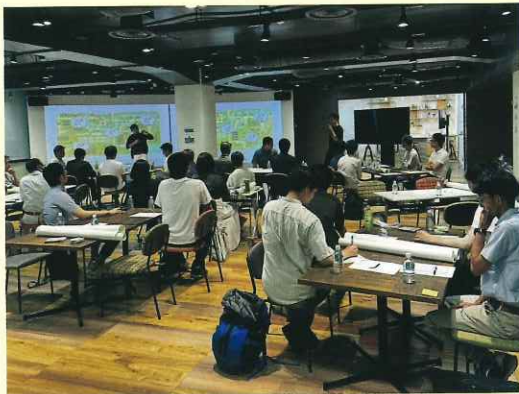
<グループワーク研修の様子>