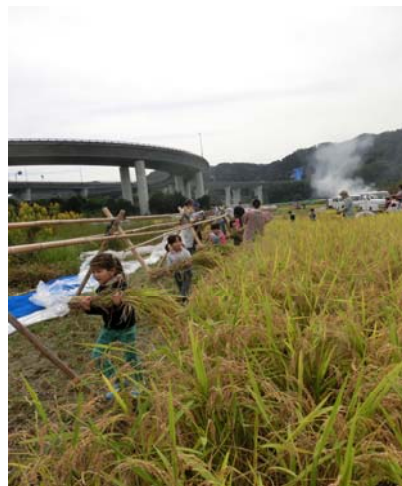
地域コミュニティ事業