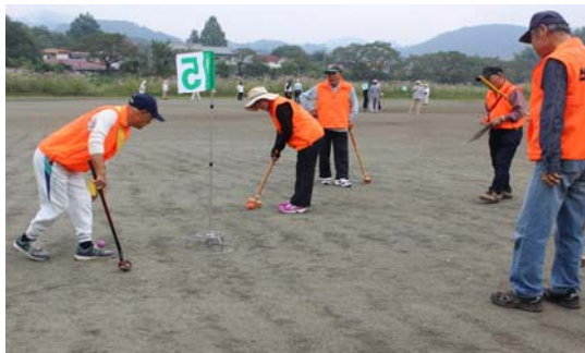
年金友の会 グラウンド・ゴルフ大会