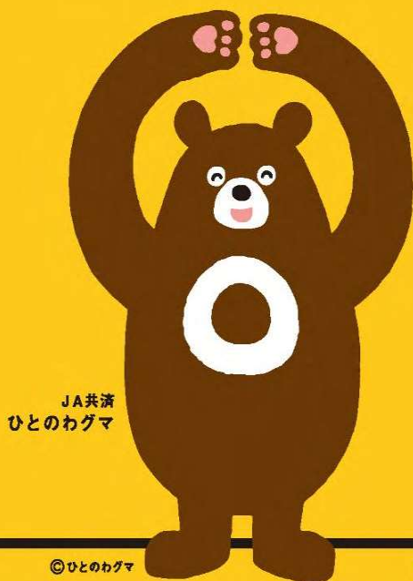
JA共済 ひとのわぐま

お客様の大切な現金等重要物を お預かりする際は、 受取書・領収書 等を 必ずお渡ししております。