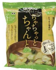
ちやちやとちやんと具だくさん合わせみそ味噌汁 429円(税込)