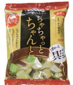
ちやちやとちやんと具だくさん麦みそ味噌汁 429円(税込)