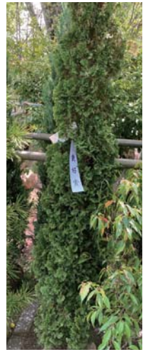
デグフルーツパイアー

20、21日に一般観覧と即販売が行われて、園芸資材の販売や植木園芸相談などもあり、会場はにぎわいました。