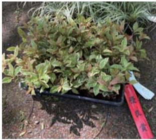
ファイリヤブコウジ