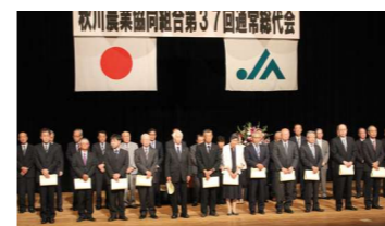
退任役員への感謝状贈呈