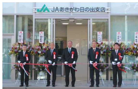
開店セレモニーでのテープカット