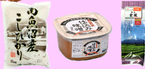
南魚沼産こしひかり2kg、お茶(紫鳳)100g×2、味噌1.8kg その他、数種類の中からお選びいただけます。

特典 1 JAあきがわで年金のお受け取りをご指定いただくと、 素敵な記念品を進呈いたします。